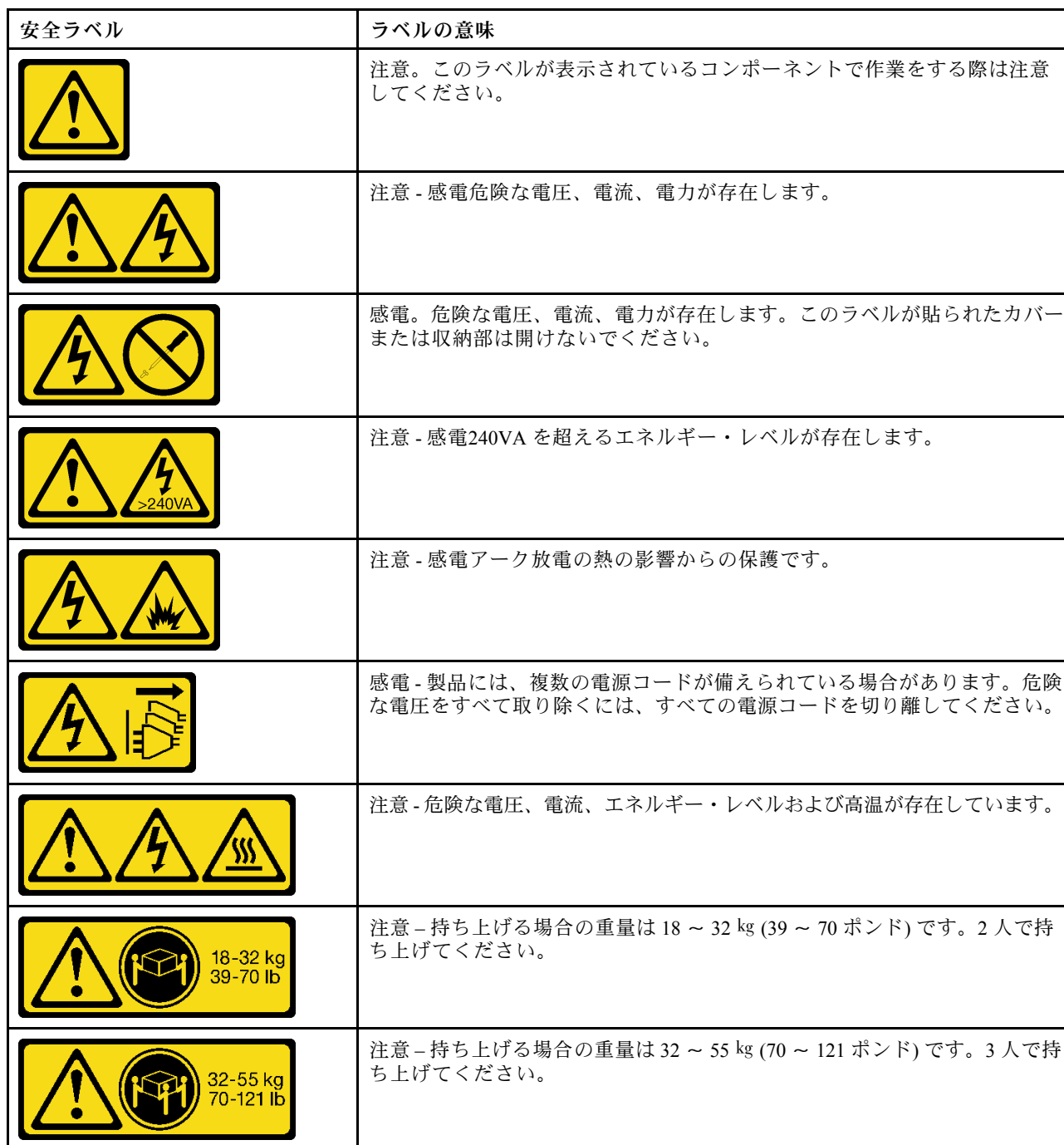
表 1. 安全ラベル

Lenovo DCG 製品に表示される可能性がある安全ラベルは、次の表に説明されています。