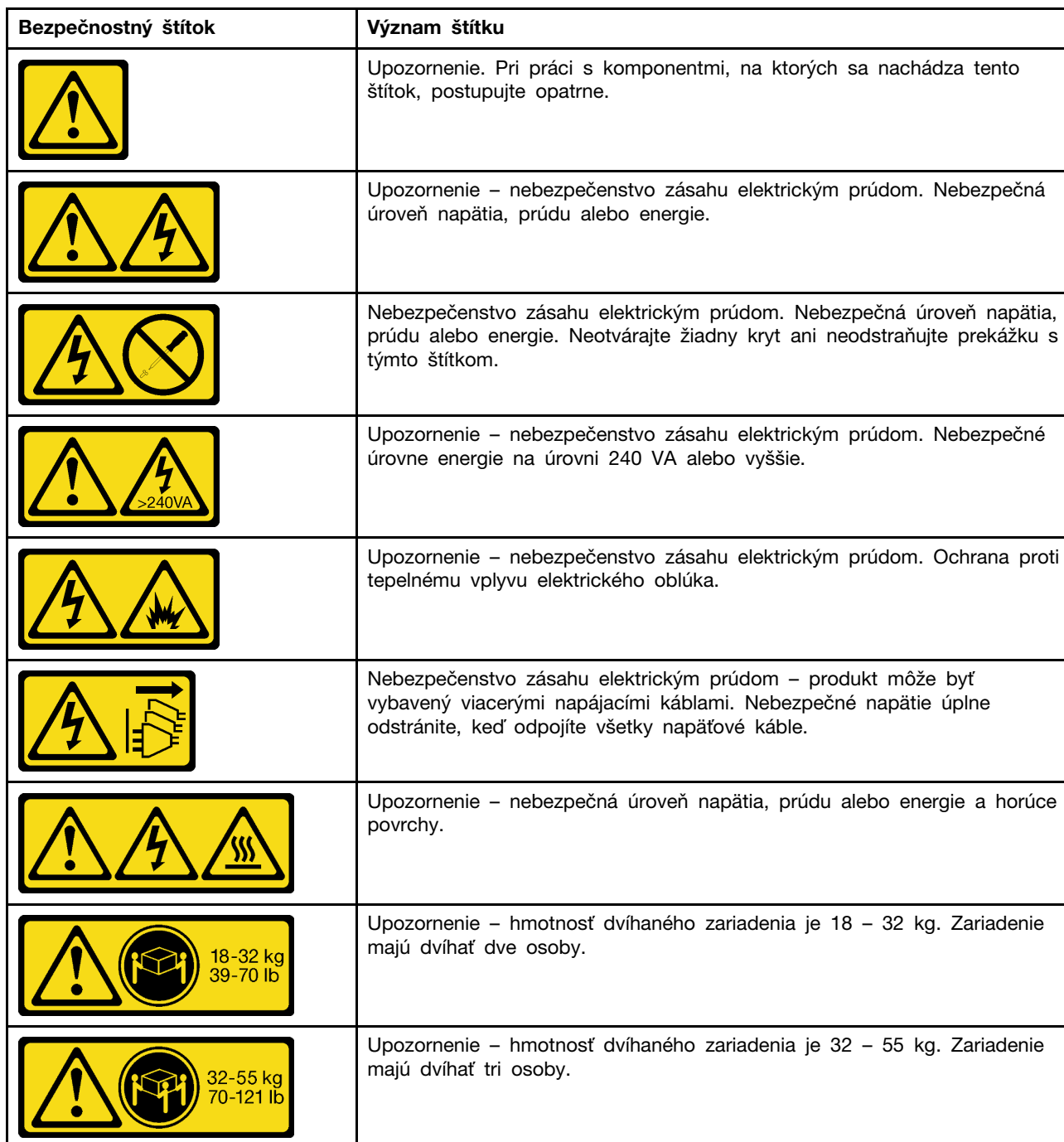
Tabuľka 1. Bezpečnostné štítky

Bezpečnostné štítky, ktoré sa môžu nachádzať na produkte Lenovo DCG sú opísané v nasledujúcej tabuľke.