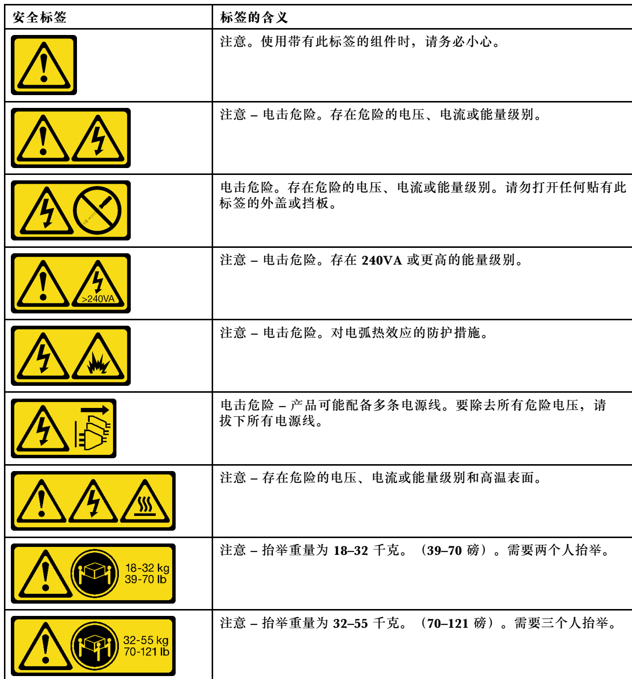
表 1. 安全标签